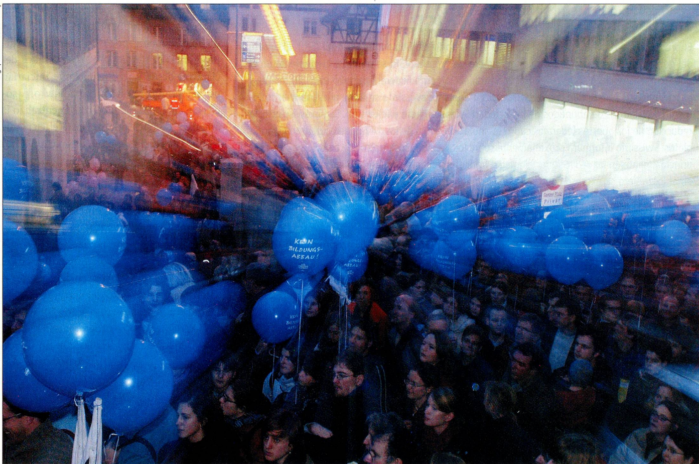
El sector rojo-verde se resistió al programa de descarga. En la foto, una demostración en Argovia contra los planes de ahorro.