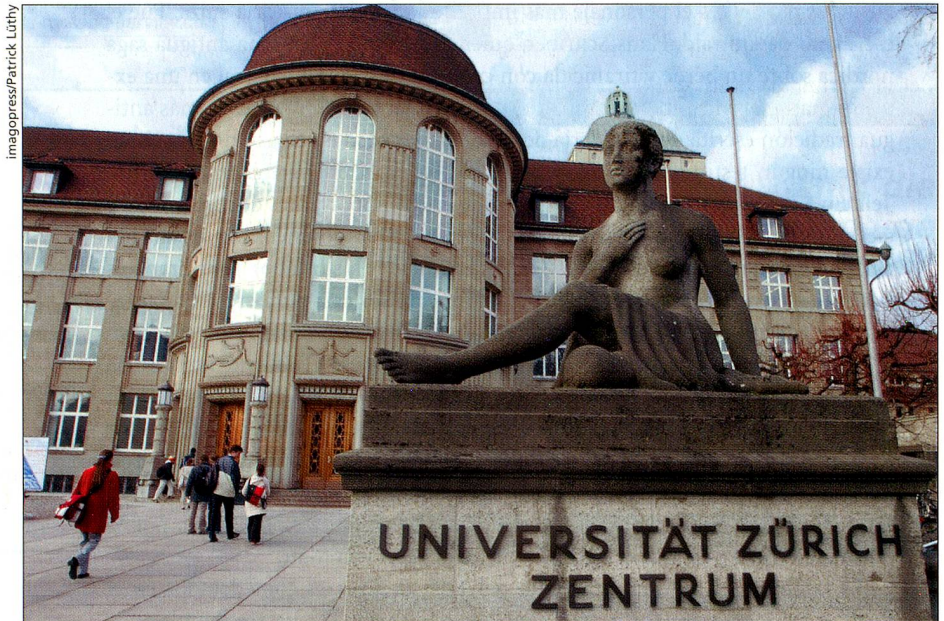
Las universidades suizas desean corresponder a la movilidad.

LA INSTRUCCIÓN UNIVERSITARIA es una prioridad declarada del Consejo Federal, explicó en diciembre Pascal Couchepin, el jefe de la política educacional de nuestro país. Esto se pone en evidencia en el formidable proceso puesto en marcha en el año 1999, en Boloña, por los ministros de educación de 29 países europeos. Por parte de Suiza, el texto fue firmado provisionalmente por Charles Kleiber, secretario de estado para ciencia e investigación. Firmada simbólicamente en la universidad más antigua de Europa, la «Declaración de Boloña» crea un sistema de diplomas fácilmente comprensibles y comparables, un «Espacio Universitario Europeo», en el que los estudiantes y los docentes pueden circular libremente. La meta es fomentar la ocupación. Se recortarán particularidades y soberanías académicas a efectos de beneficiar la competitividad mundial del panorama universitario europeo. Pero se conservará, en