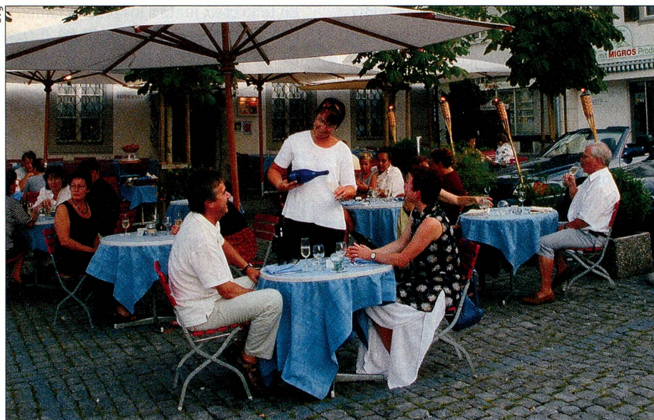
Demanda por buena cocina y servicio perfecto. Aquí, en el restaurante «Linde» de Stans (NW).

¿Busca ideas para una caminata en la región alta de Berna? ¿Desea recorrer Los Grisones en bicicleta? ¿Quiere vacaciones alpinas estivales o esquí en invierno? ¿Disfrutar el wellness, visitar un festival o un museo, recorrer una ciudad? ¿Prevé un fin de semana largo o ya está pensando en sus próximas vacaciones en la patria? Encontrará las respuestas en el sitio de Internet www.MySwitzerland.com de Turismo Suizo. El fácil y sencillo sistema le guía confortablemente a través de las informaciones y ofertas turísticas actuales y hasta incluye la contratación directa de un hotel, casa o apartamento. Desde cualquier lugar del extranjero. RR