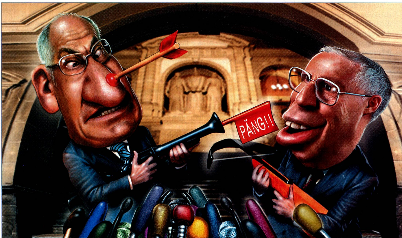
Ilustración: Igor Kravarik

Suiza está orgullosa de su democracia directa. No obstante, hay acaloradas discusiones sobre la función del pueblo y la «incapacidad de reformas» en la Suiza democrática y federal.