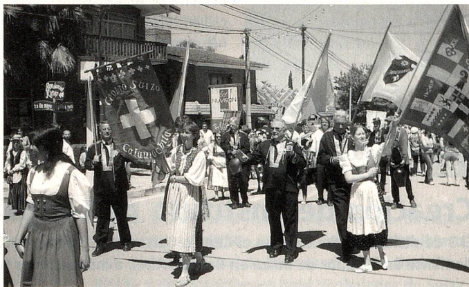
Centro Suizo de Calamuchita en el desfile de la Oktoberfest Argentina-Villa General Belgrano-

Villa General Belgrano: En la provincia de Córdoba, a 80 Km. de la Capital, sobrepasando el Lago Los Molinos, y en medio de un paisaje de sierras, bosques de pinos y arroyos, se encuentra una Villa que por las características de su diseño urbano con viviendas de aspecto europeo, amplios jardines y parques, llama la atención del viajero. Ofrece no sólo su belleza natural y el buen clima, sino que dispone de hoteles de primer nivel, cabañas y hospedajes, excelentes restaurantes, confiterías y una óptima red de servicios a lo que se suma una esmerada y cordial atención.