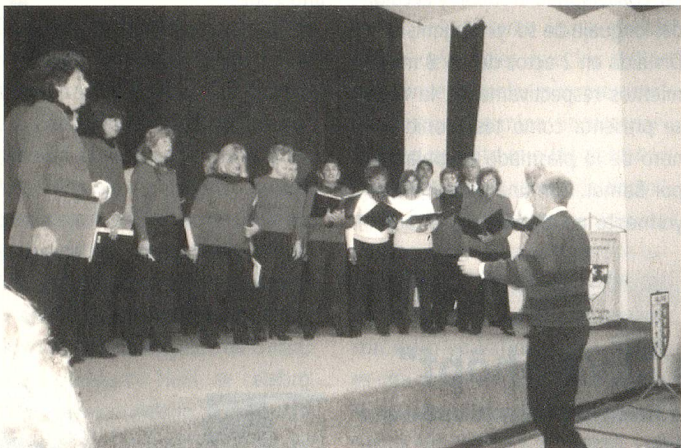
Actuación de la Intercoral Universitaria en la celebración de la Fiesta Nacional de Suiza

"La inauguración de la sede propia en agosto de 2003, constituyó todo un desafío para quienes integramos la Comisión Directiva de nuestra entidad. En ese momento supimos que habría que trabajar mucho para que "la casita" tuviera vida y para que nuestros asociados disfrutaran de ella. Hoy, mirando el camino recorrido, tenemos la convicción de que, con el Ciclo Cultural 2004, nos acercamos a aquellos objetivos.