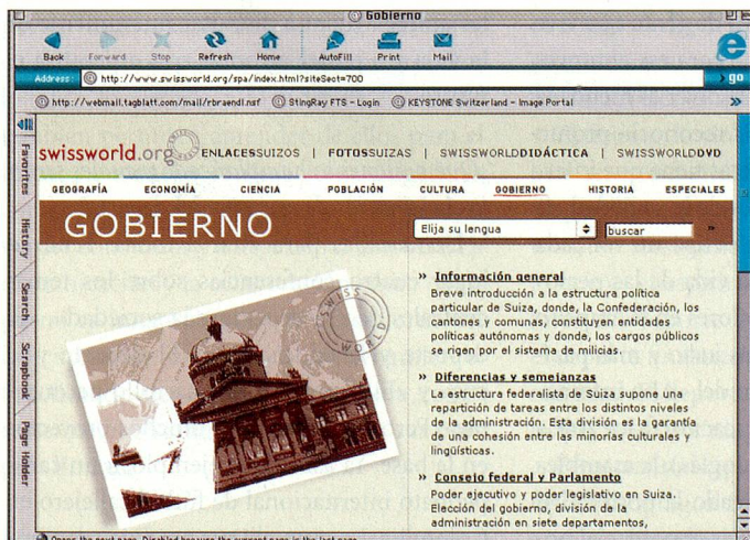
... sobre los más diversos temas de Suiza.