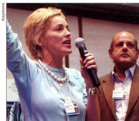
Sharon Stone en el WEF

26 de enero. Unos días después de las manifestaciones anti-WEF en Berna y Bienne, se inaugura el 34º Foro Económico Mundial en la quietud alpina de Davos. Este año el tema principal del evento, que duró hasta el 30 de enero, fue la «Solidaridad global». Los temas tratados fueron la pobreza, una globalización más equitativa, los cambios climáticos, la instrucción y educación, así como la forma de actuar de los gobiernos mundiales. En el transcurso del foro, los líderes de la economía mundial expresaron que la responsabilidad para iniciar pasos concretos está en las manos de la política. Por lo demás, el evento también estuvo caracterizado por la presencia de estrellas de Hollywood como Sharon Stone.