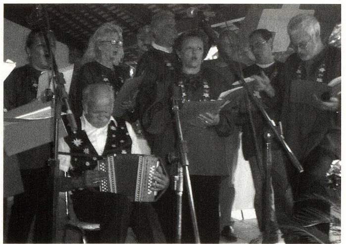
Actuación del Coro