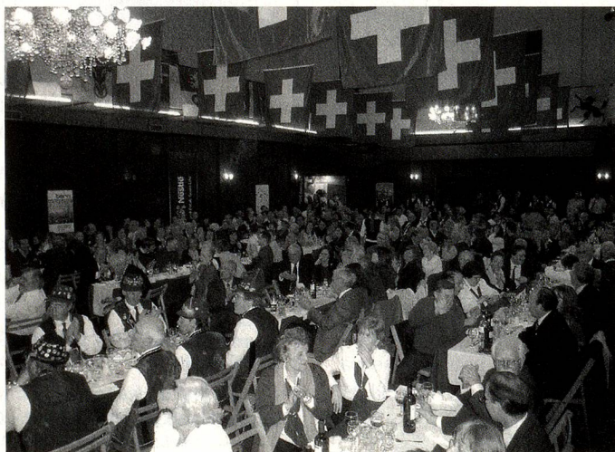
Vista del Salón durante el festejo

Para lograr este objetivo, la Asociación está organizando la Tradicional Cena Aniversario que se realizará el 7 de octubre de 2006 en la sede social. ■