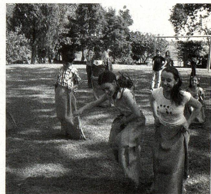
Los niños durante la carrera en bolsas