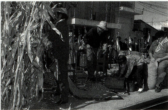
"Cosechando maíz", una de las carrozas evocativas

Desde hace mucho tiempo, el segundo domingo de junio de cada año congrega en la localidad a instituciones suizas de todo el país y de países vecinos, que llegan a ella con el fin de unirse a los festejos conmemorativos que tienen como objetivo "mantener y fortalecer la cultura suiza". El domingo por la mañana, se realiza un importante desfile evocativo del que participan también las delegaciones de instituciones suizas que se hacen presentes con sus coloridos trajes típicos, su alegre música y cuerpos de baile de niños y adultos. Después del almuerzo, los grupos de bailes y las orquestas típicas suizas alegran la tarde en la que todos los asistentes bailan hasta la noche.