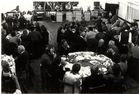
Almuerzo de Confraternidad-Club Artesano

Los festejos de los 715 años de la Fundación de la Confederación Helvética se iniciaron el martes 1º de agosto con el embanderamiento de la Plaza de los Fundadores y de la ciudad con los pabellones de Uruguay y Suiza. A las 7.30 horas se escuchó el tañido de las campanas de los Templos Católico y Evangélico. Se depositaron ofrendas florales al pie del monumento al Gral. José G. Artigas y en la Plaza de los Fundadores. Participaron las Escuelas N° 19 de Soler y N° 126 "Guillermo Tell" de Nueva Helvecia.