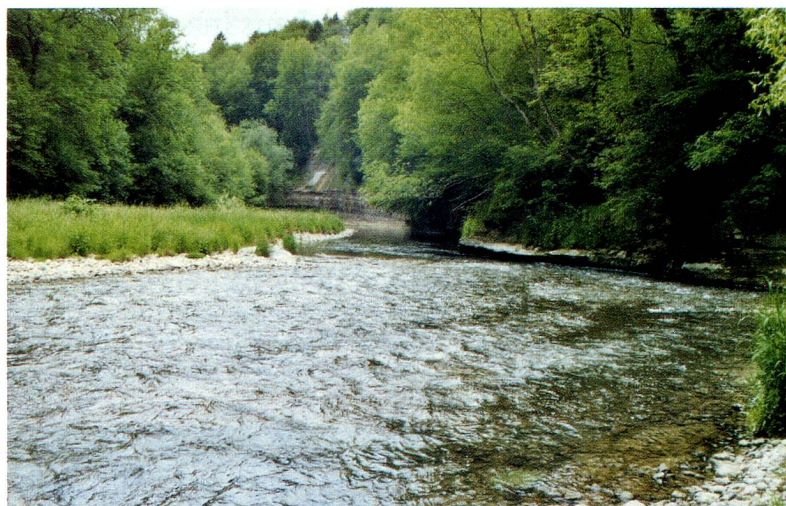
Curso natural del río Töss en Embrach, cantón de Zúrich

zonas colindantes. Habría que ensanchar el cauce de las aguas vivas, que deberían estar mejor reticuladas, y sus orillas más cuidadas. Asimismo, los cantones deberían adoptar medidas para reactivar el tratamiento del detritus. También serían responsa-