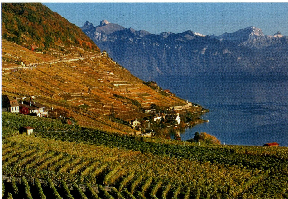
Fascinante Lavaux: vista hacia el este

Los tres soles de Lavaux. Entre Lausana y Montreux se extiende la espléndida región vitícola de Lavaux. Sus nobles vides, plantadas al pie de los Alpes en terrazas escalonadas a orillas del lago Lemán, maduran en un entorno a salvo de los excesos de la urbanización, lo que otorga pleno derecho a los ciudadanos de Lavaux a registrarla como Patrimonio Cultural de la Humanidad de la UNESCO. Por Alain Wey.