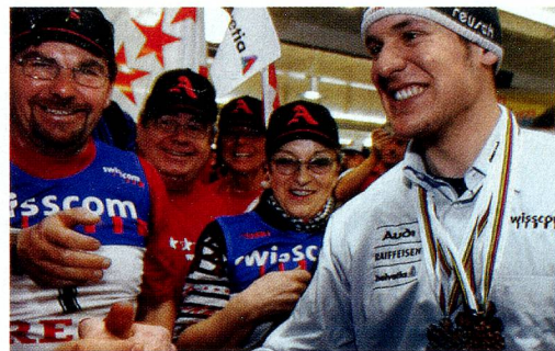
Daniel Albrecht, campeón mundial de esquí, con un grupo de aficionados

La Comisión Europea considera que las prácticas fiscales de algunos cantones suizos son «incompatibles» con el Tratado de Libre Comercio de 1972. Concretamente se refiere a las ventajas fiscales para empresas extranjeras, sobre todo de los cantones de Zug y Schwyz. Amenazada con represalias, Suiza se verá obligada a negociar. La prensa suiza critica la «presión» de Bruselas y considera que los argumentos aduci-