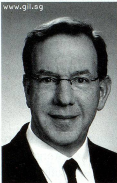
www.gil.sg Gil Schneider Unternehmensberater Singapur