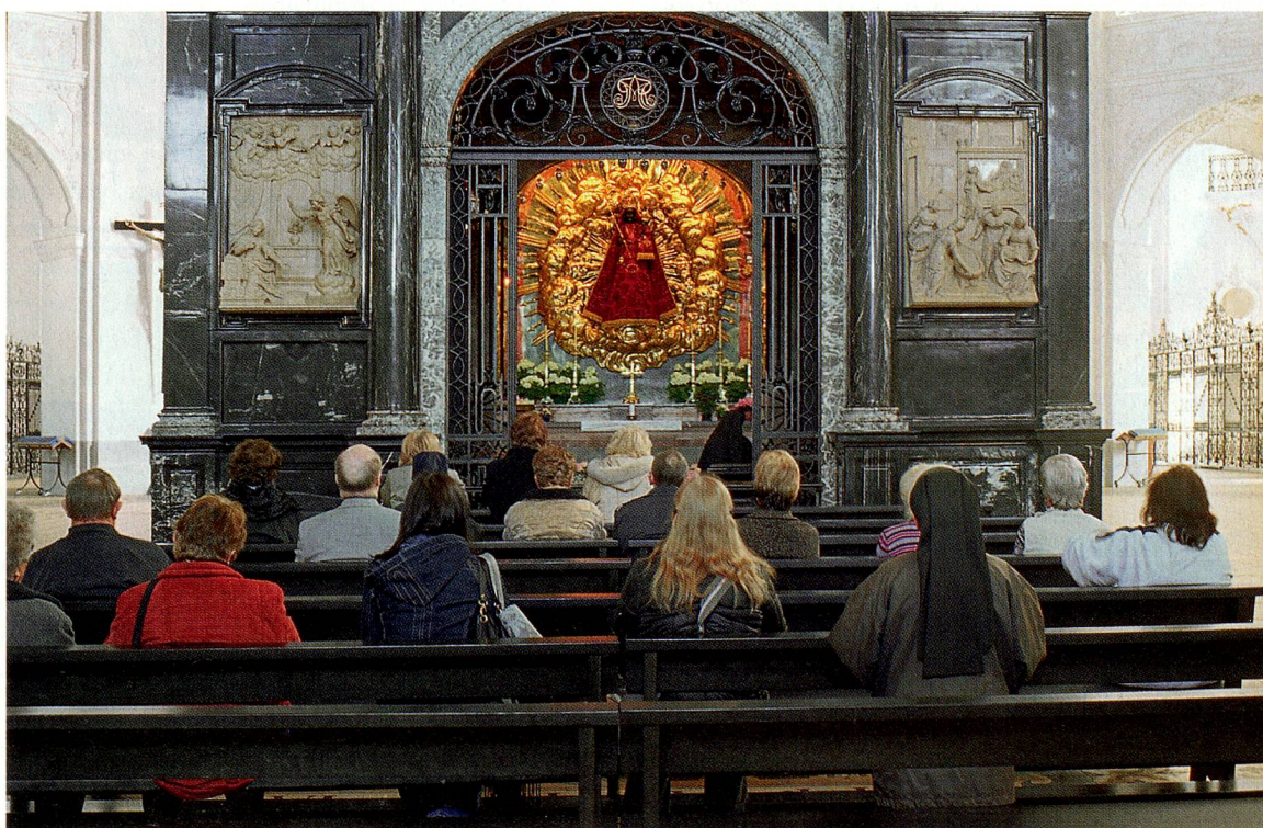
Destino de peregrinos: La virgen negra de la iglesia abacial