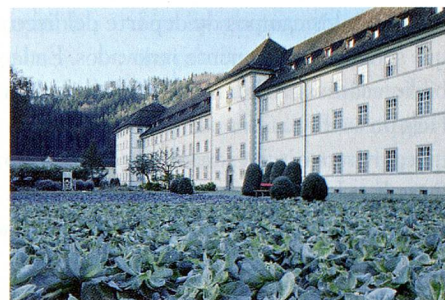
El monasterio se autoabastece

La abadía siempre fue un importante centro cultural. Mientras recorremos sus am-