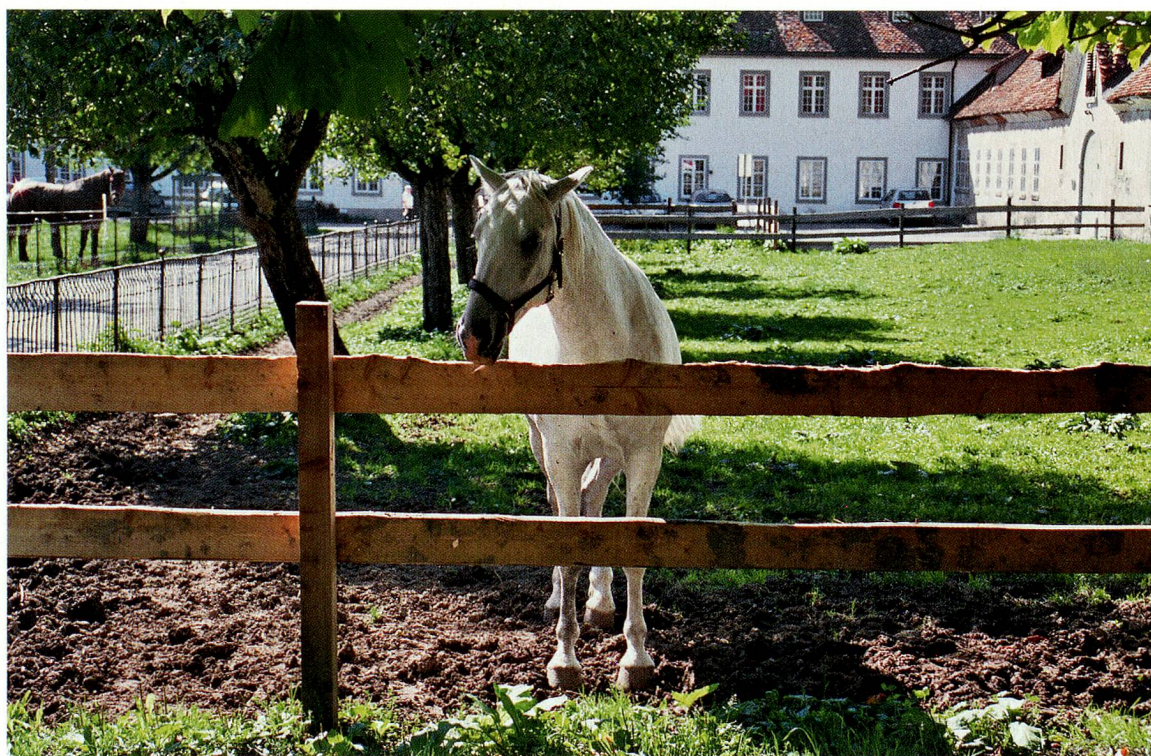
La yeguada del monasterio de Einsiedeln está considerada como la más antigua de Europa

de 1768, están en proceso de renovación total, y los talleres del monasterio (con ebanistas, cerrajeros, albañiles, pintores, etc.) se encargan de las obras. Las obras de renovación estarán terminadas a finales de 2008. En cuanto al personal, un veterinario viene varias veces por semana, una criadora de caballos de gran experiencia dirige las caballerizas y cuatro empleados se ocupan de los caballos y de los cursos de equitación. La cría de los Einsiedler ha cumplido un milenio, durante el cual se han realizado diversos cruces, pero siempre conservando el carácter deportivo de este espléndido caballo, cuyas raíces históricas datan del siglo X.