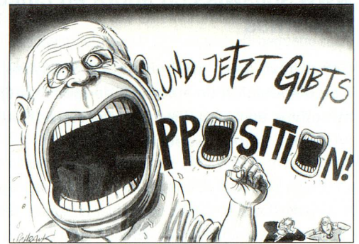
El ex consejero federal Christoph Blocher en su antigua/nueva función. El caricaturista Peter Schrank en el Basler Zeitung