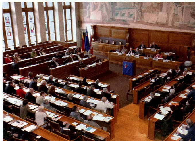
...se reunió el Consejo de Suizos en el Extranjero.