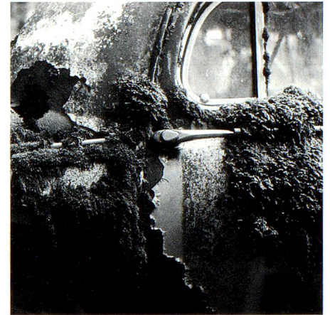
Cementerio de coches de Gürbetal, BE (página 7).