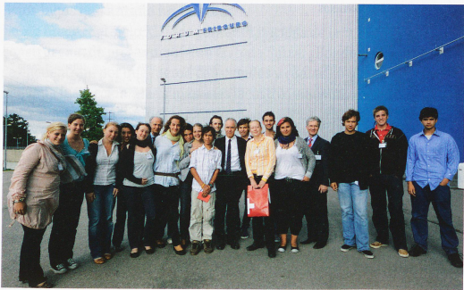
86º Congreso de Suizos Residentes en el Extranjero en Friburgo