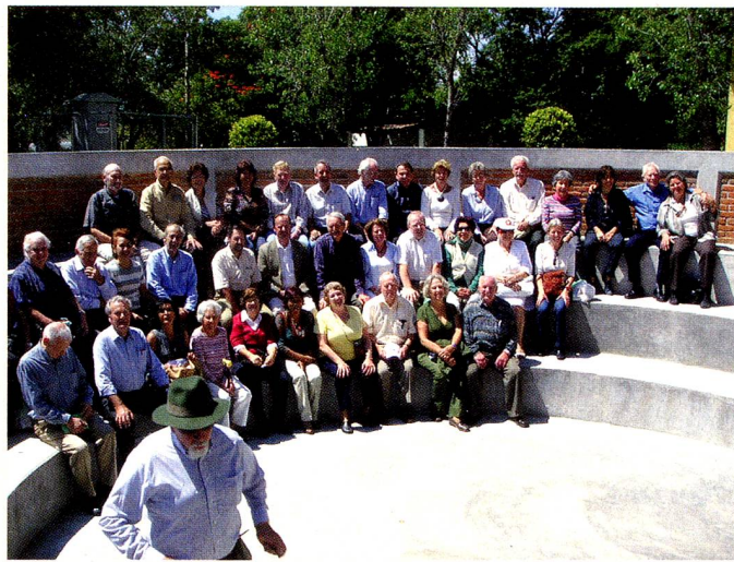
Grupo "60 Plus"

Como siempre fue un agradable paseo en el que volvimos a encontrarnos los integrantes de