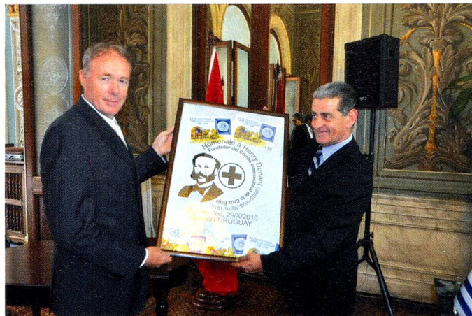
Homenaje a Henry Dunant-Presentación matasello