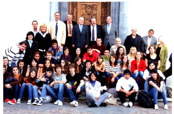
En Suiza, colonenses y valesanos. En el centro, el Embajador de Argentina en Suiza