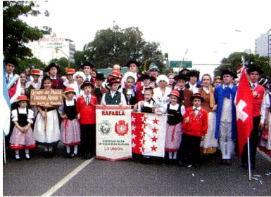
Desfile de la Integración