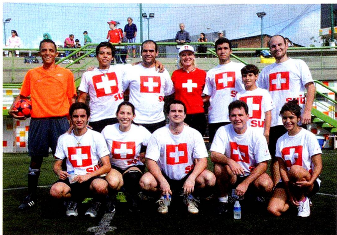
Equipo de fútbol suizo organizado por FUES.

guetes de las manos de San Nicolás en la sede de la Fundación y además, aprendieron a cocinar las típicas galletas navideñas suizas.