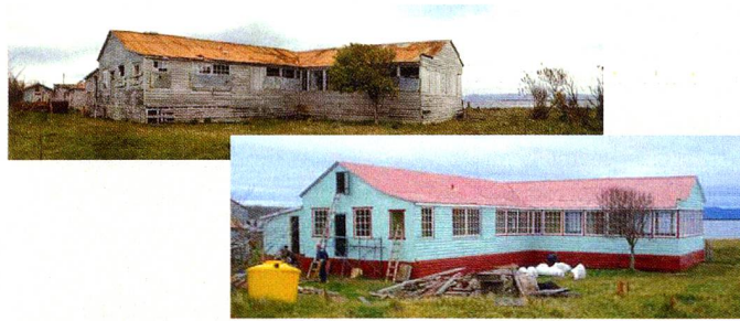
Edificio administrativo antes y después de la restauración