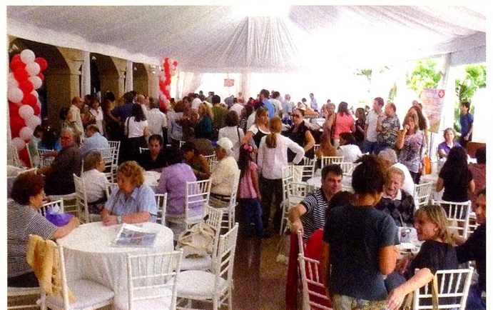
Festival Anual de las Damas Suizas.

En el marco de las actividades de Responsabilidad Social, la FUES organizó una jornada de recolección de juguetes para ser entregados en una merienda, a los niños de uno de los institutos que asiste con distintas actividad y aportes. Los niños Kinder Mis Amiguitos del barrio de Petare de Caracas, recibieron ju-