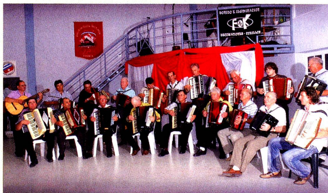
Acordeonistas que participaron