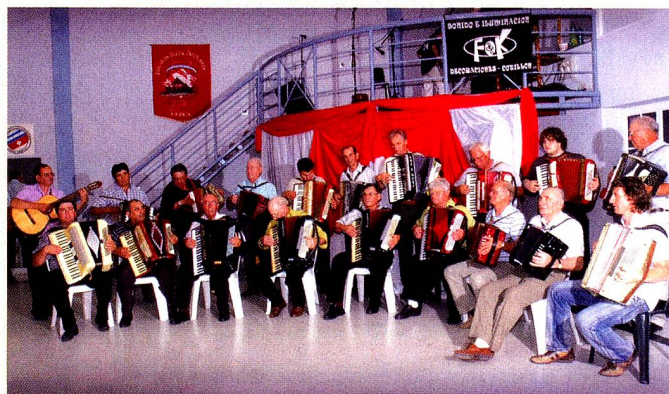
Acordeonistas que participaron