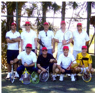
Torneo de tenis 2010

Estas actividades tienen buena respuesta, con un éxito muy variado ya que no todos los suizos están realmente interesados en conocer a otros compatriotas en la linda Costa Rica. Desde la Asociación tratan de aumentar la participación ya