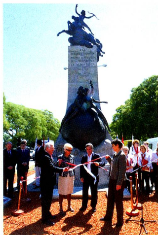
Las autoridades presentes inauguran el Paseo Suizo

Con el empeño de desarrollar espacios de pensamiento, expresión y educación, comenzaron los tradicionales talleres y cursos de idiomas abiertos a la co-