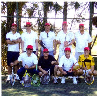
Torneo de tenis 2010

Estas actividades tienen buena respuesta, con un éxito muy variado ya que no todos los suizos están realmente interesados en conocer a otros compatriotas en la linda Costa Rica. Desde la Asociación tratan de aumentar la participación ya