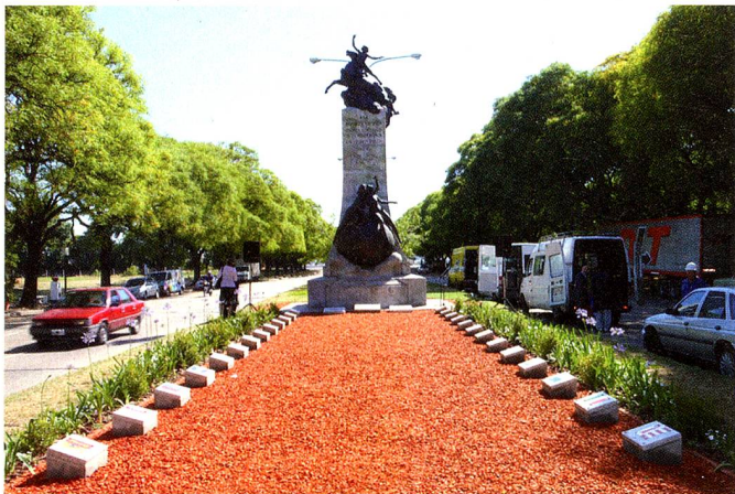
Monumento "Suiza y Argentina unidas sobre el mundo" en el Paseo Suizo.