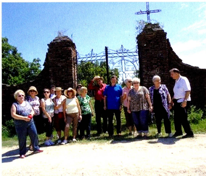
Visita a Villa Urquiza 6-03-2011