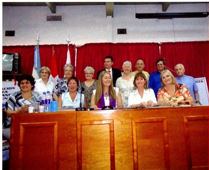
Acto Central 5-03-2011