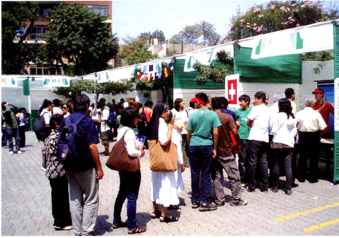
Stand de la Embajada de Suiza-Puertas abiertas del Goethe-Institut

Lima el pasado 2 de abril con el fin de familiarizarse con la cultura de habla alemana. Entre los países invitados se destacó el stand de la Embajada de Suiza que fue una de las principales atracciones del día. Las generaciones más jóvenes acudieron para solicitar información sobre las oportunidades universitarias en Suiza. Bolsas y viseras con los colores de Suiza distribuidos en el stand formaron una ola roja en el patio del Goethe-Institut.