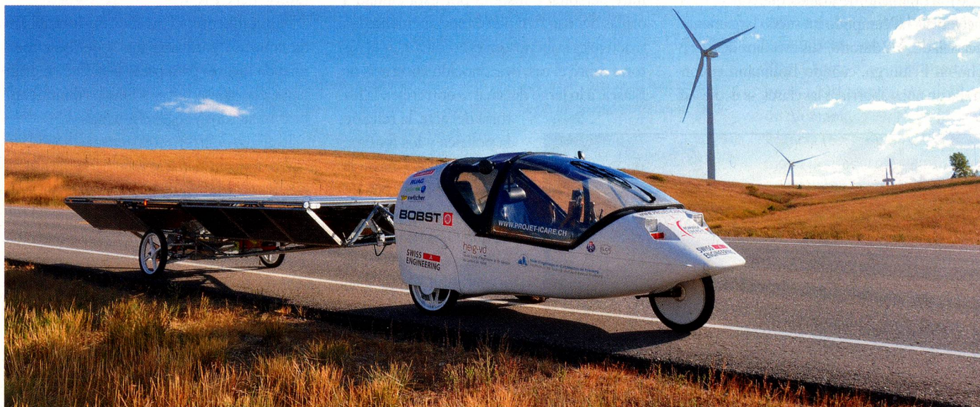
El reconvertido Twike llamado «Icurette» es propulsado por energía solar y eólica

Producción académica: 2 trabajos de diplomatura (bachelor), 10 trabajos de fin de semestre, 2 universidades colaboradoras en el proyecto, cientos de horas de investigación Tiempo de espera para pasar las aduanas: En Perú, 2 horas, en Túnez, 4 horas, en Marruecos, 6 horas, en Ecuador, 13 días, en Estados Unidos, 2 meses.