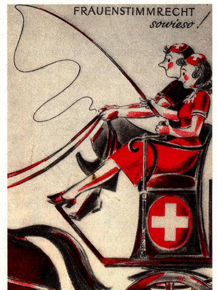
en torno a 1945