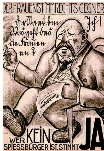
en torno a 1920