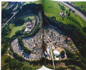
Sittertobel, Openair de Saint-Gall