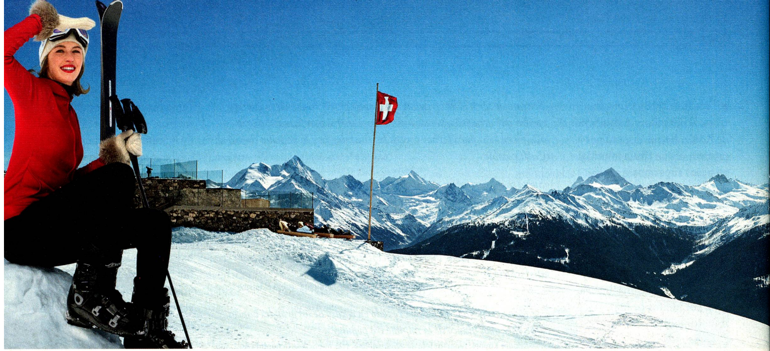
Chetzeron, Crans-Montana, Valais