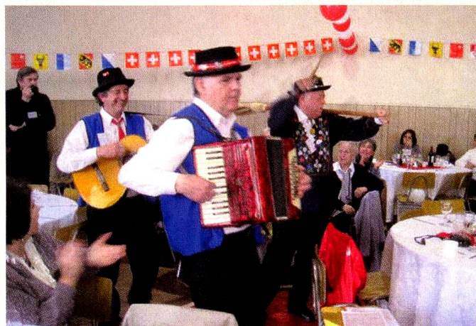
La música alegró el encuentro en Traiguén.

Rousseau fue filósofo, educador, autor, músico y naturalista a la vez, fue también revolucionario y uno de los padres del pensamiento democrático moderno. En una de sus obras llamada El contrato social, aborda muchos de los conceptos que