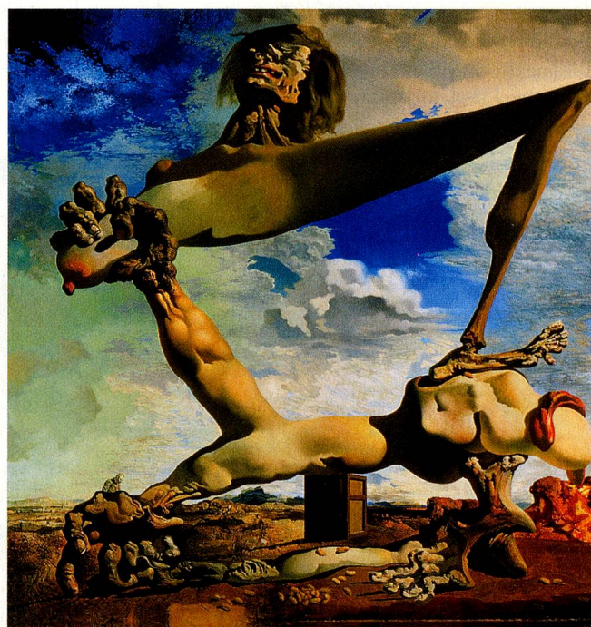
«Construcción blanda con judías cocidas - Premonición de la Guerra Civil» Salvador Dalí, 1936