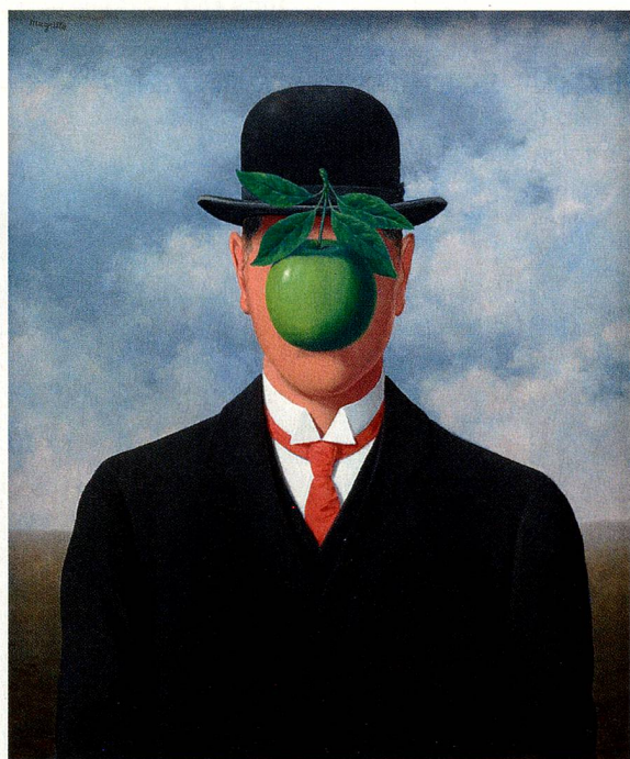
«Der grosse Krieg» (La gran guerra) René Magritte, 1964