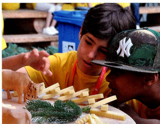
Festivo ambiente en pasados campamentos de verano de la Fundación para los niños suizos en el extranjero

El viaje hasta el aeropuerto de Zúrich y desde allí hasta el domicilio de cada participante deberá ser organizado y costado por los padres.