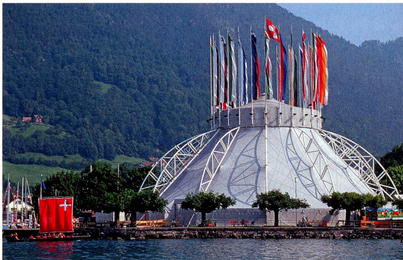
La plaza de los Suizos en el Extranjero el año 1991 con la carpa de Botta instalada para el 700º aniversario de la Confederación Helvética

El plazo para la presentación de ideas expira el 31 de marzo de 2012, y las que resulten premiadas se presentarán públicamente en julio/agosto en Brunnen, así como en el Congreso de Suizos en el Extranjero en Lausana, en agosto de 2012.