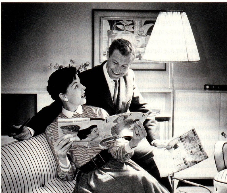
Prototipo de matrimonio feliz, hacia 1958, foto de Max Roth (sin título)