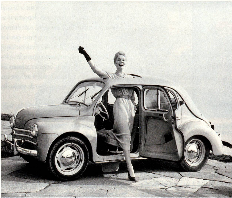
Fotos en el sentido de las agujas del reloj: Renault-Heck-4CV, publicidad hacia 1964, foto de Max Roth

«Schöner leben, mehr haben», en alemán, publicado por Thomas Boumberger y Peter Pfunder; 267 páginas; ISBN: 978-3-85791-649-6; Precio: unos CHF 48.-