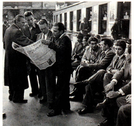
Inmigrantes italianos en la estación de Zúrich, hacia 1950