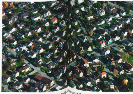
Cerca de Buchs, en el cantón de San Gall: Filas regulares de viviendas unifamiliares

La urbanidad que respeta el medio ambiente es el nuevo modelo a seguir. Como contrapartida, se pone cada vez más en tela de juicio la hasta ahora sólida protección forestal, si bien es justamente donde ha incidido más la planificación urbanística de la Confederación. Siguiendo la máxima de que solo quien repuebla en otro lugar puede talar un bosque, se mantuvo constante la superficie forestal, incluso en las regiones del centro de Suiza, en los últimos decenios. Pero ahora aumenta la presión sobre bosques cercanos a las ciudades. Actualmente, Berna discute acaloradamente sobre la conveniencia de talar parte del bosque de Bremgarten para construir una