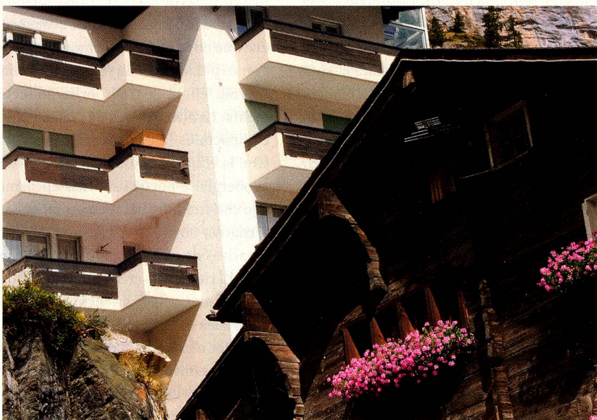
Davos y Zermatt: Las fotos dejan claro por qué se ha aprobado la Iniciativa de las Segundas Residencias

medida, no se han asumido las necesarias responsabilidades.»