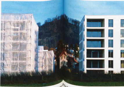
Kónig, en la Suiza central: Pese al premio Wakker a su paisaje, el desarrollo urbanístico no siempre es un panorama armónico