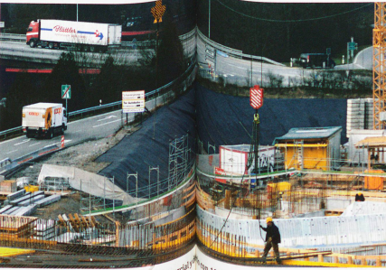
Bern-Brünnen: Construcción de un centro comercial y un hotel y piscina cubierta con 11 cines, 10 restaurantes,

urbanización cerca de la ciudad, para 8000 personas. El argumento principal es que talar bosques cercanos a las ciudades conduce a una menor proliferación urbanística que parcelar praderas verdes en la periferia de los cascos urbanos.