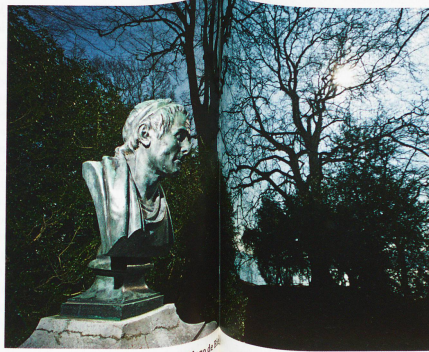
Estadua de Rousseau en la Isla St. Peter, en el lago de Biel.

Además, en su república absoluta hay un bienestar social absoluto, un interés que se ha hecho estatal y de todos en cuanto a la igualdad y la libertad, que nunca puede pasarse por alto, ni siquiera en un referéndum. «Esto presupone que todos los distintivos de esta voluntad común también se reflejan de verdad en la mayoría de votos. Y si ese no es el caso, deja de haber libertad.»