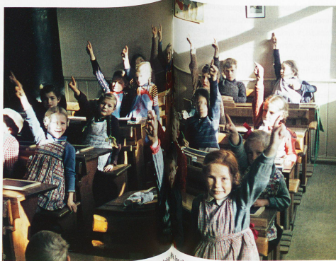
La escuela en los años 40: Los profesores tenían una autoridad y los alumnos eran disciplinados y obedientes

HarmoS – acrónimo de armonización de la escolaridad obligatoria – es un concordato entre los cantones, que sienta las bases de la escolaridad suiza. Es el propio pueblo quien quiso acabar con los veintiséis sistemas distintos, cuando sometió a un plebiscito estos artículos constitucionales en 2006, con una aprobación «soviética» del 86%. Tras sus grandes aires revolucionarios, lo que sobre