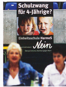
Cartel de la UDC contra la escolarización a los 4 años

La intensidad de la campaña de la UDC ha sentido precedentes. Todos los grandes partidos han intentado, a su vez, perfilarse en su grupo, lo que ha situado a la educación en el núcleo de una batalla generalizada, porque los