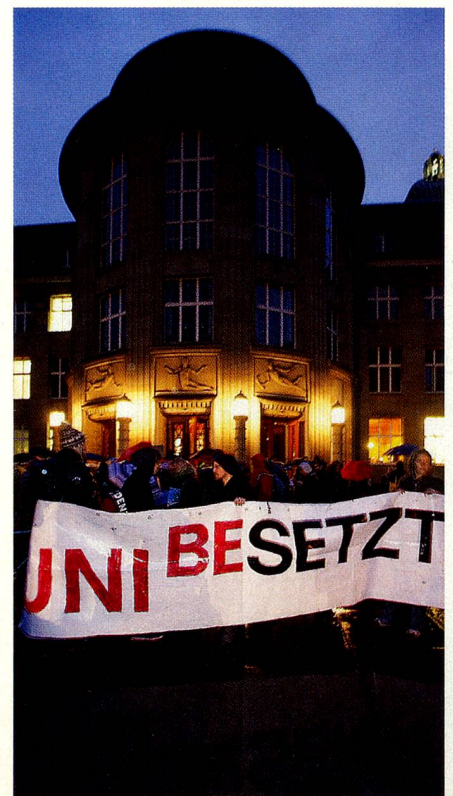
Protestas estudiantiles en Zúrich

La precarización sufrida por los estudiantes conduce a tensiones desde 2009. En las manifestaciones, Bolonia es el chivo expiatorio de todos los males, un cajón de sastre donde se mezclan las críticas a la reforma europea y los retos suizos. Por otro lado, los contestatarios ignoran las dificultades que tendrían en el mercado laboral globalizado si Suiza otorgara diplomas sin reconocimiento internacional. Pese a sus daños colaterales, Bolonia, más que una opción, es una necesidad.