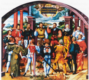
El juramento de confederación con los representantes de 13 cantones, con San Nicolás de Flüe delante, a la izquierda. Este cuadro de Humbert Mareschet, de 1586, puede verse en el Ayuntamiento de Berna