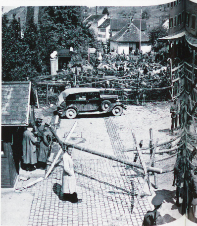
Refugiados tras la verja de la frontera de St. Margrethen, San Gall, mayo de 1945

ilustrado, Maiszen lleva a cabo un impresionante bosquejo, sin grandilocuencias, de la trayectoria y el desarrollo del pueblo suizo, insumiso y a menudo litigante dentro de sus propias fronteras, hasta convertirse en una sociedad moderna con un Estado eficiente. Por otra parte, en esta obra se desmitifican fábulas como las del juramento del Rütli, el flechazo a la manzana o la