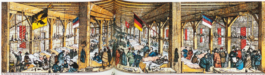
Großer Flüchtlingssaal im Kornhause in Bern, Januar 1850. Gran sala de los refugiados