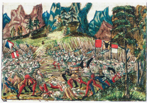
La Batalla de Morgarten (1315) fue la primera batalla de los confederados contra los Habsburgo. Representación extraída de la crónica ilustrada de Christoph Silbereysen de 1576