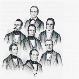
El primer Consejo Federal en 1848. En el centro, el Presidente de la Confederación, Jonas Furrer; Josef Manziger, Henri Druey, Wilhelm Matthias Naeff, Friedrich Frey-Hérold, Stefano Francini y Ulrich Ochsenbein (en el sentido de las agujas del reloj, desde arriba)