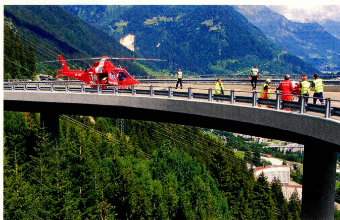
Intervención en accidentes de tráfico: a menudo, la policía llama a la Rega

les: medios de comunicación suizos publicaron que la Rega también utilizaba sus jets-ambulancia para vuelos por encargo sin participación suiza, y que de vez en cuando repatriaba a soldados extranjeros de zonas en guerra. Efectivamente, la Rega realiza tales intervenciones por encargo de seguros internacionales, cuando son médicamente necesarias. La Rega afirma que para ellos sólo existen pacientes, con o sin uniforme, y subraya que en estos casos todos los costes corren a cuenta de los clientes, incluidos los de mantenimiento y amortización de los aviones, y que las donaciones de los patrocinadores nunca se utilizan para vuelos por encargo. El órgano de inspección de la fundación dio la razón a la Rega y la descargó del reproche de «uso