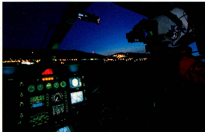
En la cabina de un helicóptero durante un vuelo nocturno