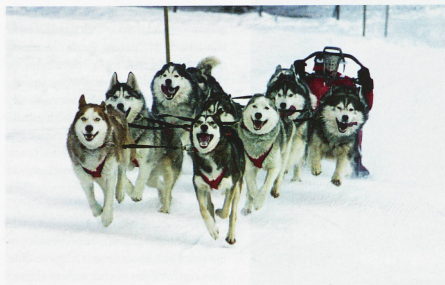
Un tiro de perros en plena acción durante las carreras de trineos tirados por perros en Kandersteg

Escenas como en el Polo Norte, jaurías de perros de trineo que aullan, barrantando el comienzo inminente de una carrera. Y si bien Norteamérica y Escandinavia son los campeones de esta disciplina, Suiza cuenta con más de 200 «mushers» (conductores de trineo con perros) y unos 3000 perros nórdicos de pura raza. Y donde hay pasión, las carreras proliferan en pleno invierno. Además de la competición y la cría, la estación fría absorbe a toda una industria de turismo de excursiones en trineo con perros, cuya demanda supera ampliamente la oferta. Meterse en la marmita de las grandes epopeyas de Alaska se está convirtiendo claramente en un modo de vida. Los «mushers» suizos más avezados incluso participan en las carreras de larga distancia que han llevado a la gloria a este deporte, como es el caso de Pierre-Antoine Héritier, del Valais, que hizo la carrera Yukon Quest (Alaska-Canadá), de 1600 km, en 12 días el año 2010. Y detrás de la valentía se desvela todo un mundo especial. La vida de los perros nórdicos cuya cría está estrictamente reglamentada en Suiza para preservar la pureza de las razas. Deslicémonos, pues, tras las huellas de los perros nórdicos, de los criadores y los «mushers» de Suiza.