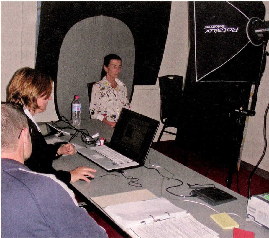
Ciudadanos suizos registrando los datos necesarios para el nuevo pasaporte en la estación móvil