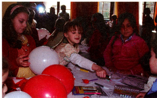
Los niños: el futuro del Club Suizo

suizos establecidos en la región desde hace ya largo tiempo y a los nuevos inmigrantes a ingresar al Club Suizo de Osorno donde no solo encontrará cordiales reuniones, sino también ayuda y apoyo durante los primeros pasos en el hermoso sur chileno.