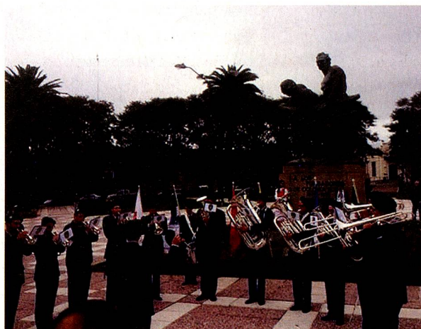
Actuación de la "Swiss Army Brass Band" en la Plaza de los Fundadores