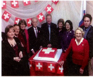
Comisión Directiva Sociedad Suiza de Paysandú

por razones económicas, militares y de ayuda mutua el 1º de agosto de 1291, se unieron y fundaron la Confederación Helvética; a través del tiempo se fueron agregando otros, sumando actualmente los 26 cantones que constituyen la actual República Federal.