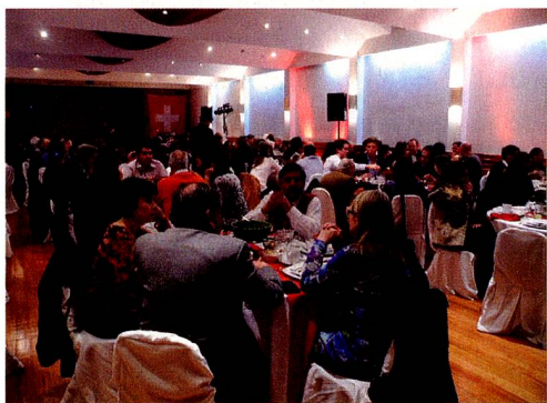
Socios y amigos del Club Suizo de Santiago

El programa de este año se inició con la Canción Nacional de Chile, Canción Nacional de Suiza en francés y en alemán. Esta fue la primera