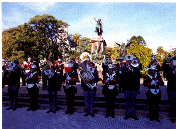
Bandas Militares de Suiza y Argentina unidas en la interpretación de un tango