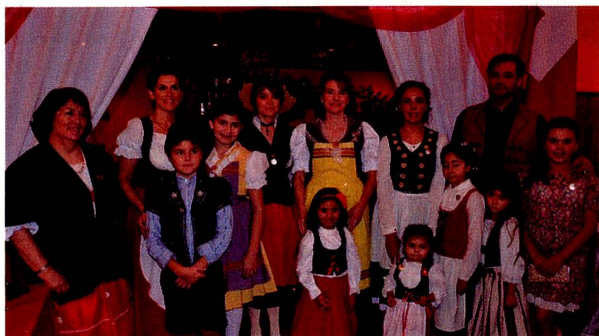
Niños y adultos con trajes típicos en el festejo del Círculo Suizo de Magallanes