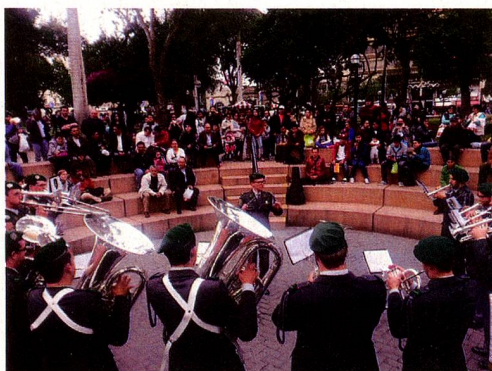
Banda Militar Suizo en el anfiteatro de la Plaza Central de Miraflores