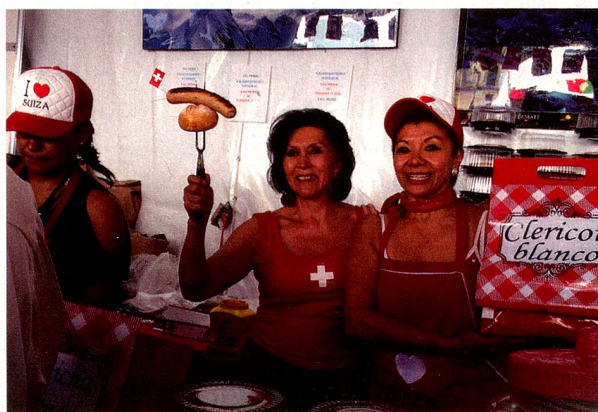
Venta de salchichas en el stand de Suiza

tés (1562) a la Corona Española que lo adquirió para construir la administración del Virreinato de la Nueva España.