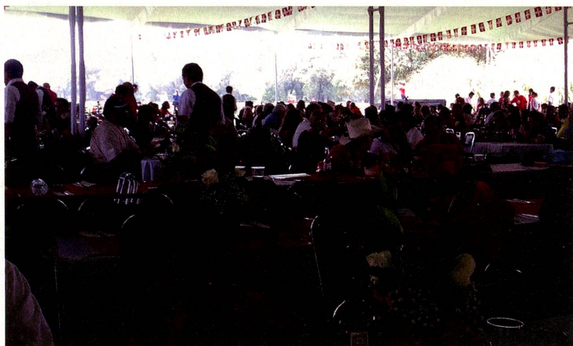
Vista general de los asistentes

Asistieron 1027 personas entre suizos y mexicanos, familiares y amigos; se degustaron salchichas schübling, ensaladas de papa, y diversos platillos suizos y mexicanos, acompañados por vino, cerveza, refrescos y café.