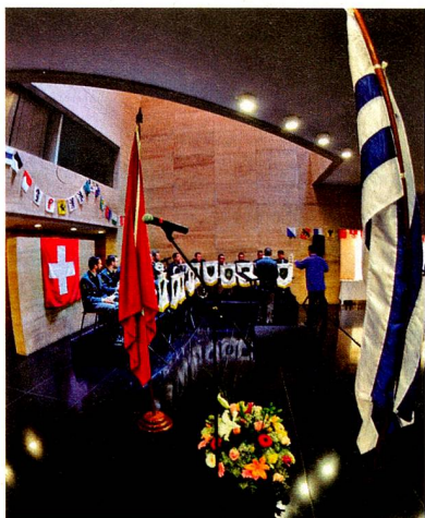
Banda Militar Suiza en el Auditorio Nacional.