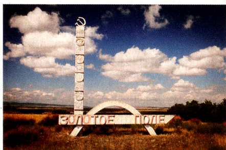
Valle de Zúrich, hoy Zolotoe Pole: Ucrania Fundado en septiembre de 1805 Número de habitantes: 4.000 Origen de los habitantes: ucranianos, rusos y tártaros de Crimea