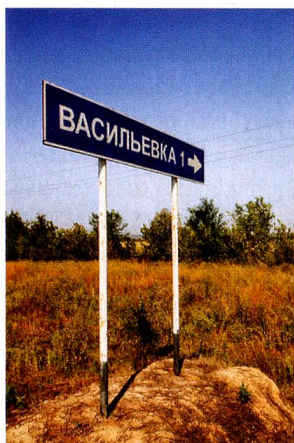
Basilea, hoy Wassiljewka: Rusia Fundada el 20 de agosto de 1767 Número de habitantes cuando se fundó: 166 Localidades vecinas junto al Volga: Glarus, Lucerna, Zug, Schaffhausen, Unterwalden, Soleura, Zúrich, todas fundadas en 1767/1768

PETRA KOCI „Weltatlas der Schweizer Orte“, en alemán; Editorial Limmat, Zúrich, 2013; 288 páginas, con fotografías de Benno Gut; CHF 39,50, Euro 33.-; www.limmatverlag.ch