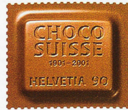
El «Choco Suisse» de 2001 huele a chocolate