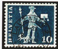
Desde 1960 se han emitido casi 1500 millones de esta estampilla de 10 rappens