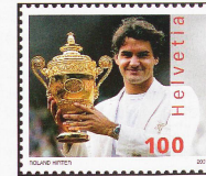
También las estrellas vivientes como Roger Federer están muy solicitadas para aparecer en las estampillas

ha invertido mucho más de 50.000 francos es «en gran medida invendible y carece de valor». El consejo del experto fue que sencillamente utilizara las estampillas de su colección aún sin franquear, y eso es lo que hace ahora Fiechter.