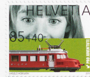
La estampilla de Pro Juventute de 2013 con recargo benéfico