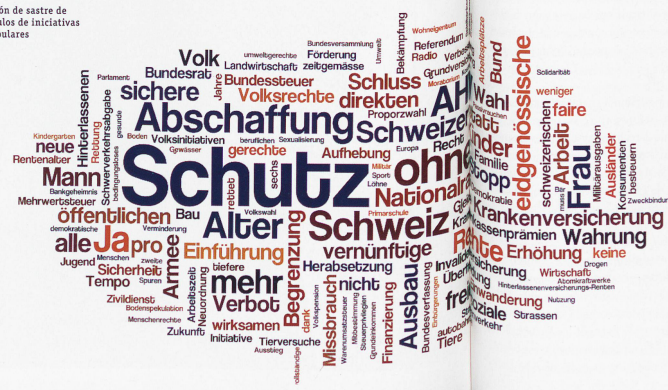
Cajón de sastre de títulos de iniciativas populares