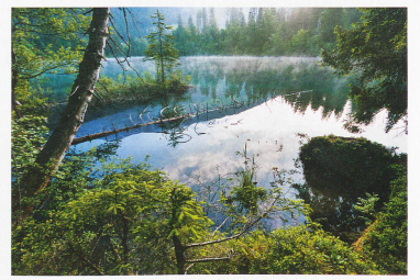
Lago de Cresta en Flims, cantón de los Grisones