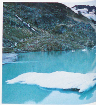
Glaciar Gaull, en el cantón de Berna, y el lago de Fählen al fondo, al amanecer