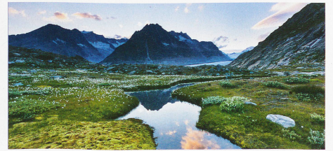
El afluente del lago Märjelen, al extremo del gran glaciar del Aletsch, en el cantón del Valais