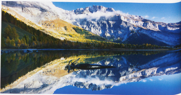
Lago de Derborence en el cantón del Valais, con la punta rocosa Tour Saint-Martin, también llamada Quille du Diable (cono del diablo)