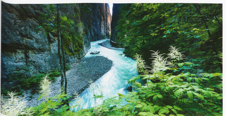
El afluente del Aare entre Meiringen e Innertkirchen, en el cantón de Berna