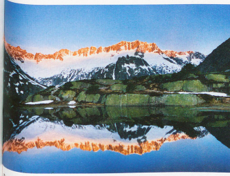
Parque alpino de Göschenen en el cantón de Uri, con las cimas de la cadena montañosa Damma al fondo