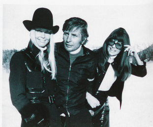
Günter Sachs con su futura mujer, Mirja, y Gita Wranding, 1969