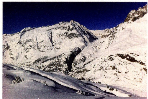
Aletscharena en la estación de esquí Bettmeralp, Valais

Italiano: www.admin.ch/opc/it/federal-gazette/2014/6213.pdf