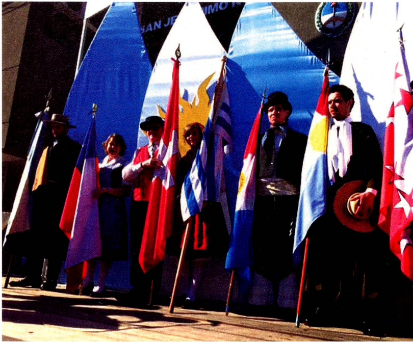
Banderas hermanadas en el escenario principal

clarada Monumento Histórico Nacional donde los inmigrantes asistían a las ceremonias religiosas, pasando por los rostros de las familias fundadoras y su descendencia, la vida doméstica, las tareas en el campo - equipos de trilladoras, los trabajadores junto a las herramientas agrícolas, horquilleros, bolseros, maiceros-, antiguas casas de campo, la vida social -bandas de música, desfiles, equipos de fútbol, fiesta del Tiro Federal, fiestas suizas, familiares-, las celebraciones religiosas -casamientos, visitas de autoridades eclesiásticas, Colegio de las Hermanas Josefinas, desfile de Corpus Christi-. Un centenar de imágenes...apellidos de familias que hoy día habitan la localidad... edificios que aún permanecen...la fotografía es memoria del pasado proyectada al presente que le da un valor testimonial y social.