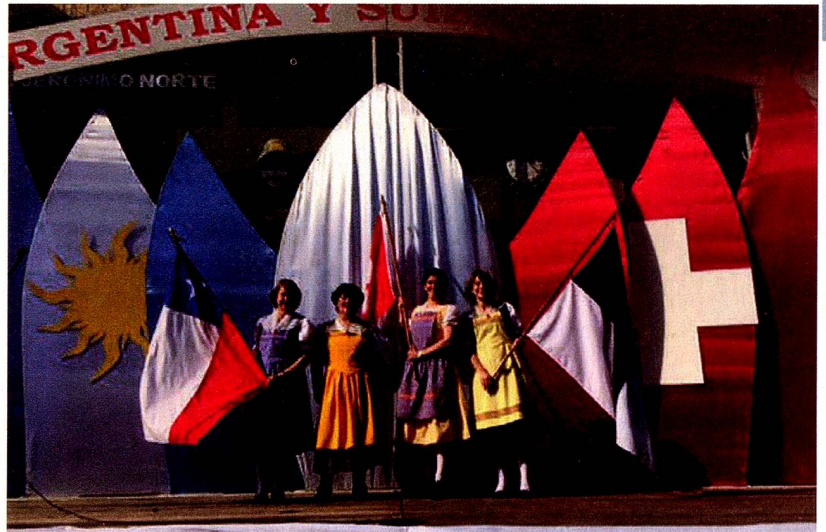
La delegación de Chile en el escenario principal

La Fiesta Nacional del Folclore Suizo se realiza anualmente, en el mes de junio y este año ha tenido una connotación especial ya que se enmarcó en el Bicentenario del ingreso del Cantón de Valais a la Confederación Helvética. Año jubilar para Suiza ya que tres cantones festejan en 2015 el ingreso a la CH de Ginebra, Neuchâtel y Valais. Además se concretó el "Hermanamiento" entre las Comunas de Brig-Glis (Wallis/Suiza) -origen de las familias que fundaron la colonia en el año 1858- y la Comuna de San Jerónimo Norte, coincidiendo también con la celebración de los 800 años de la fundación de la ciudad de Brig/Wallis.