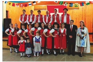
Ballet de la Asociación Helvetia de Línea Cuchilla, Embajador de Suiza, reina nacional del Folclore Suizo 2015

El Sr. Hans Peter Mock, Embajador de Suiza en Argentina, la reina nacional del Folclore Suizo 2015, autoridades locales, suizos de la Provincia de Misiones y el grupo de danzas suizas de la Asociación Helvetia de Línea Cuchilla.