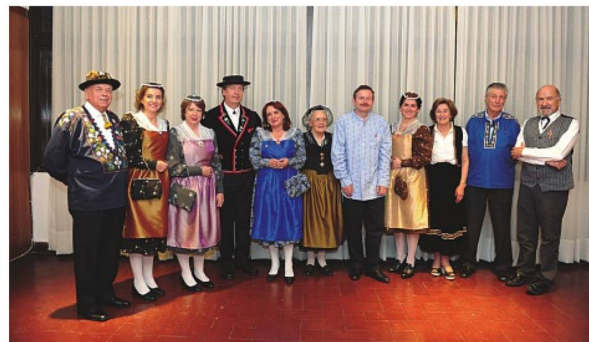
Asistentes al festejo con trajes típicos suizos

Todas las actividades propuestas resultaron muy motivadoras para los socios que participaron con entusiasmo. La Cena Aniversario se realizó en el Club que lució renovado, con un excelente menú de comida suiza y música en