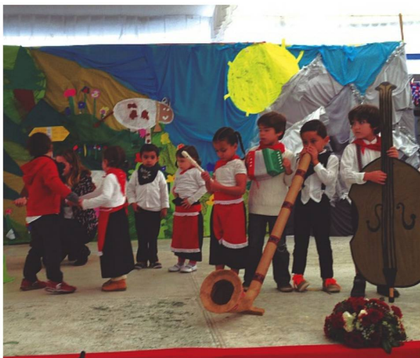
Actuación de los más pequeños del Colegio Suizo

personas, que disfrutaron de la celebración y después de un pic-nic en las instalaciones del Colegio.