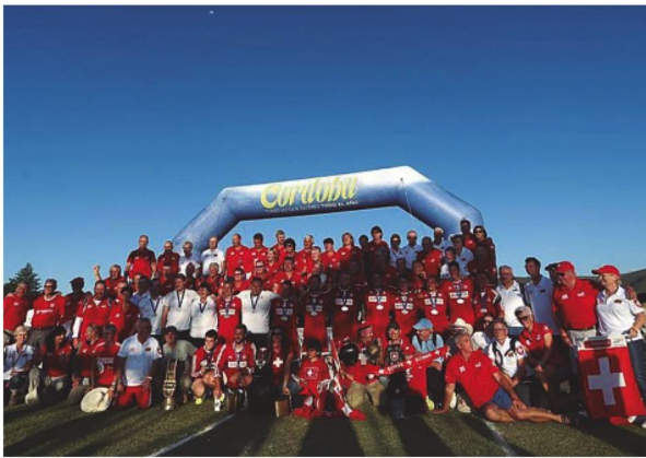
Suiza: medalla de plata