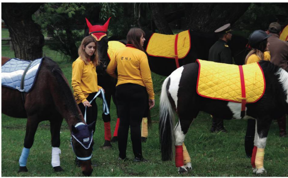
Jóvenes voluntarias de A.A.A.E.P.A.D.

fuerzo”. Cerró su mensaje haciendo referencia al trabajo en equipo que seguramente logrará los objetivos previstos.