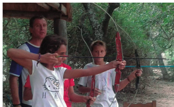
Práctica de arquería