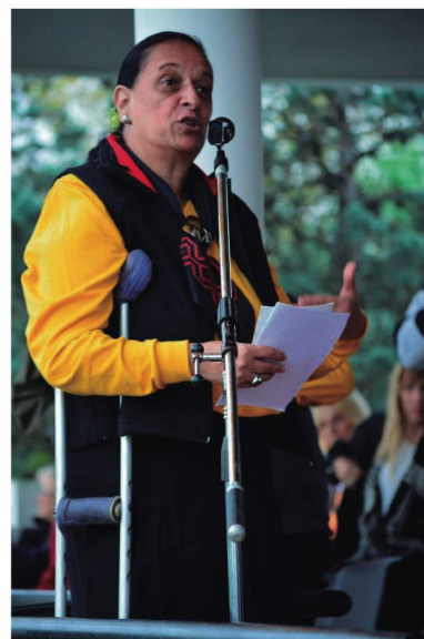
La fundadora y directora del programa se dirige a los asistentes

A su vez, el Director de la Escuela Militar de Equitación dio la bienvenida a la Fundación Zoonrisas y se refirió al Programa E.N.I. como "un lugar de encuentro, comprensión y aprendizaje mutuo...un esfuerzo que vale la pena... la alegría de los niños justifica cualquier es-