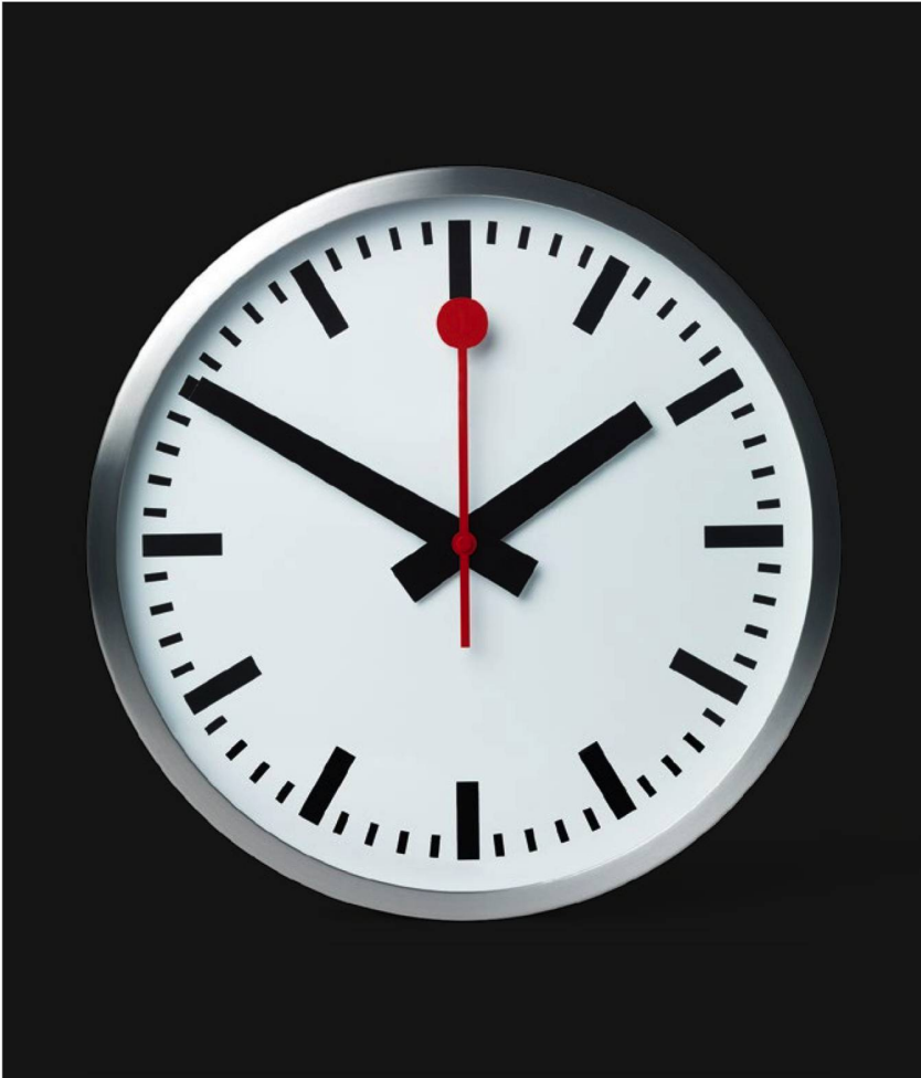
El ingeniero suizo Hans Hilfiker inventó en 1944 el famoso reloj de alimentación eléctrica, sincronizado cada minuto por vía telefónica.