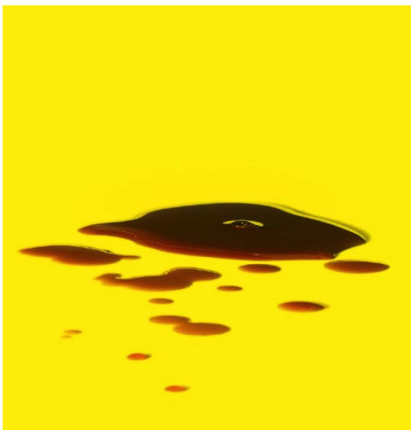
Tras dedicarse a las sopas instantáneas, Julius Maggi, de Frauenfeld, inventó en 1886 el condimento líquido del mismo nombre.