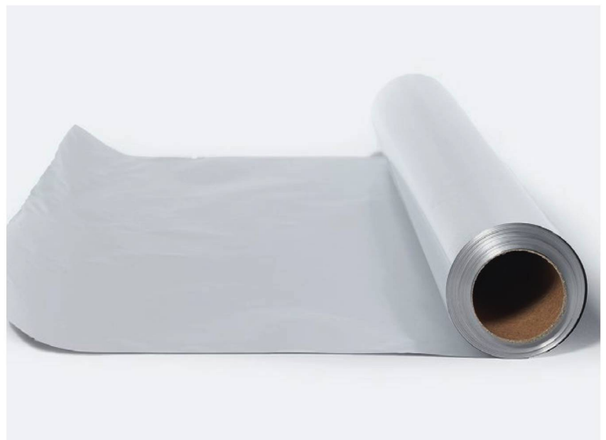
En 1910, el ingeniero suizo Robert Victor Neher registró la patente de "la laminación del papel de aluminio con el característico sonido crepitante".