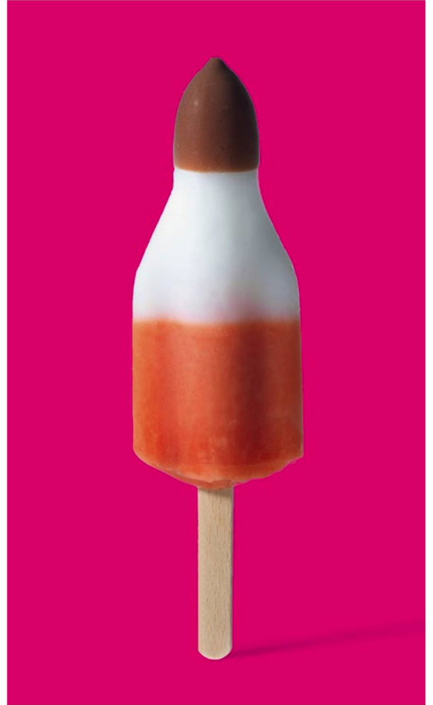
El clásico helado suizo "El cohete" se inventó en 1969, poco después del primer aterrizaje en la Luna y hasta la fecha se venden unos 8 millones al año.