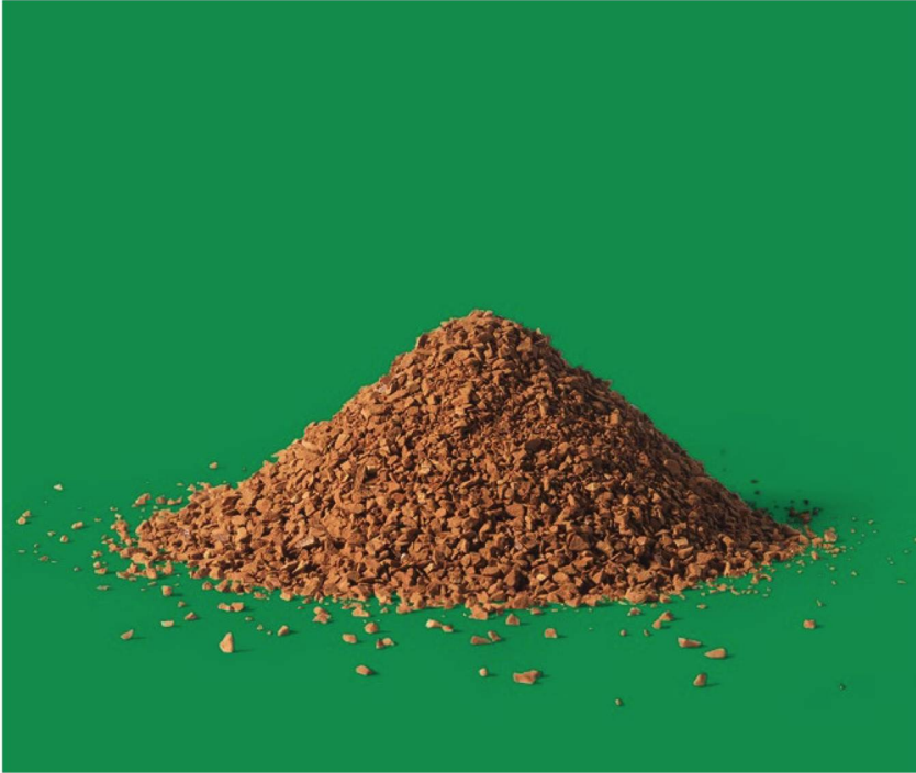
El café soluble en polvo es un invento suizo. En 1938 Nestlé lanzó al mercado la primera lata.