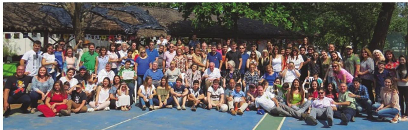
XXIII Encuentro Familia Schaerer