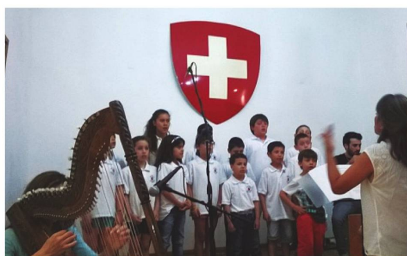
Coro de Niños Mundo Sonoro