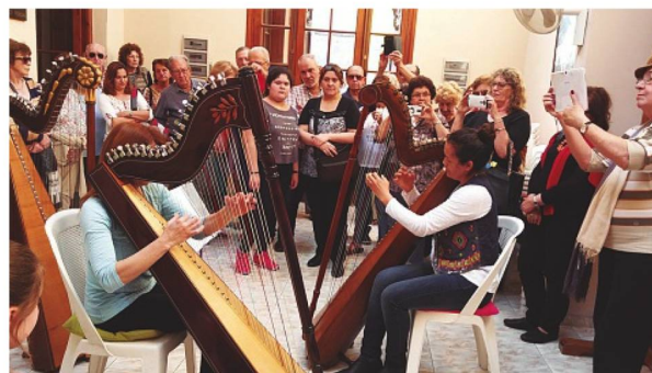
EVA en la Sociedad Suiza de Paysandú