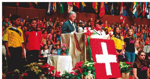
Didier Burkhalter con los jóvenes de Colombia/diciembre de 2013

Para los jóvenes deportistas colombianos, es toda una ex-