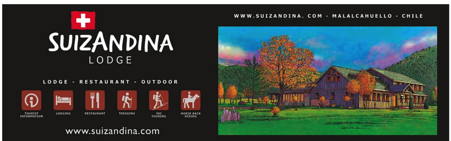
Ivana y su pasión: los caballos

tivo de su partida y su respuesta fue: "Sergio, mi esposo". Es el mejor amigo de su primo chileno y lo conoció en su primer viaje a Chile en el año 2001. Como él vivió en Italia por casi tres años, mantuvieron una relación a distancia entre Parma y Zürich. Cuando decidieron vivir juntos