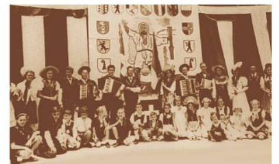
1- Fiesta Suiza 1º de agosto 1920 2- Día de campo en el Desierto de los leones-Julio 1922 3- 1º de agosto 1947