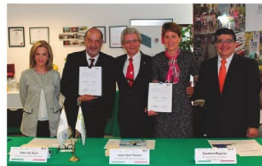
Firma del Convenio entre la SwissCham y la CONUEE en eficiencia energética