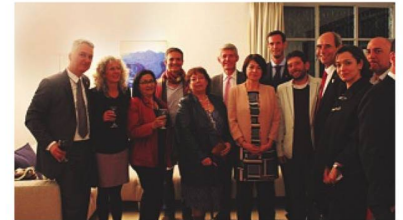
Festejo en Medellín