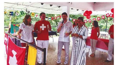
Festejo en Cali