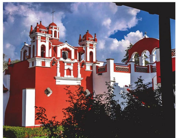
Fachada de la Hacienda Panoaya