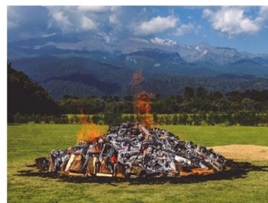
Tradicional fogata