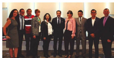
Evento sobre Inclusión Laboral y Diversidad LGBT+ en colaboración con Zurich México

traordinario Mariachi “Esto es México”. El final del festejo fue la extraordinaria fogata que tuvo como fondo, la vista de los nevados volcanes el Popocatepetl y la Ixtlacihuatl.